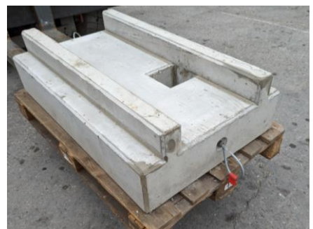
Abb.: Wärmepumpen Fundamente