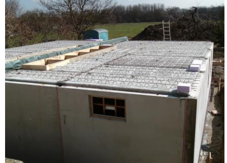
Abb.: Filigrandecken (Elementdecke)