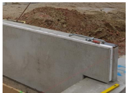
Abb.: Isolierte Wände (Sandwichwände)