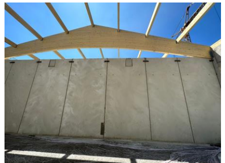
Abb.: Große Wände + Vordachwand