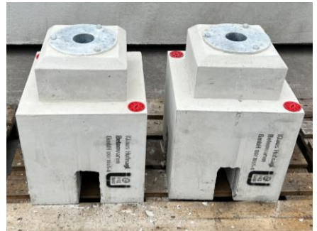
Abb.: E-Ladesäulen Fundament