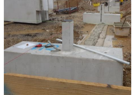
Abb.: Köcher- und Punktfundament